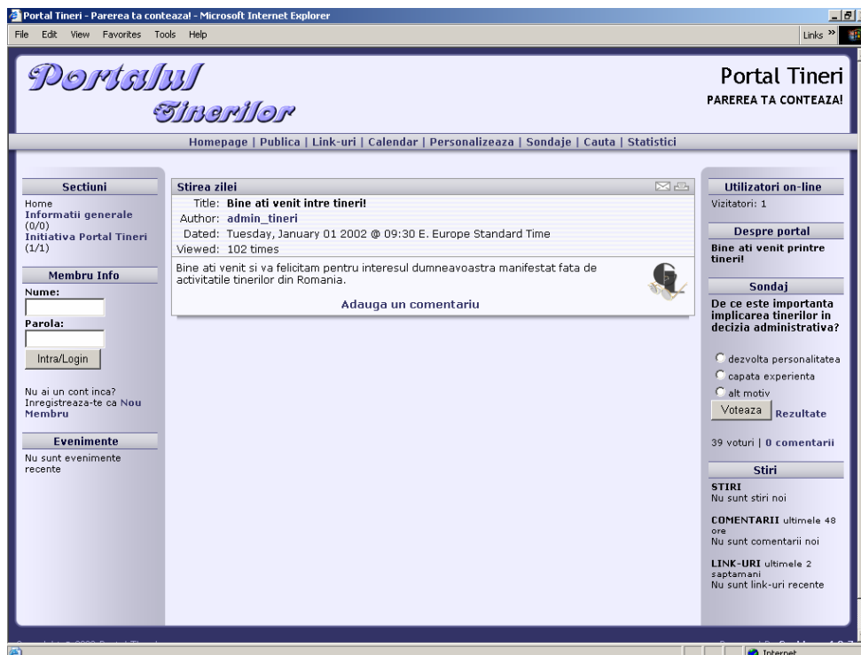
Figura 1 Homepage-ul portalului tinerilor

O opțiune foarte importantă la proiectarea homepage-ului portalului a fost alegerea logo-ului și a siglei portalului. Drept logo al portalului a fost aleasă sintagma: Parerea ta contează! , care sugerează importanța și totodată necesitatea implicării tinerilor la decizie. Sigla portalului este Portalul Tinerilor , siglă care se află plasată în colțul de stânga sus al fiecărei pagini (figura 1).