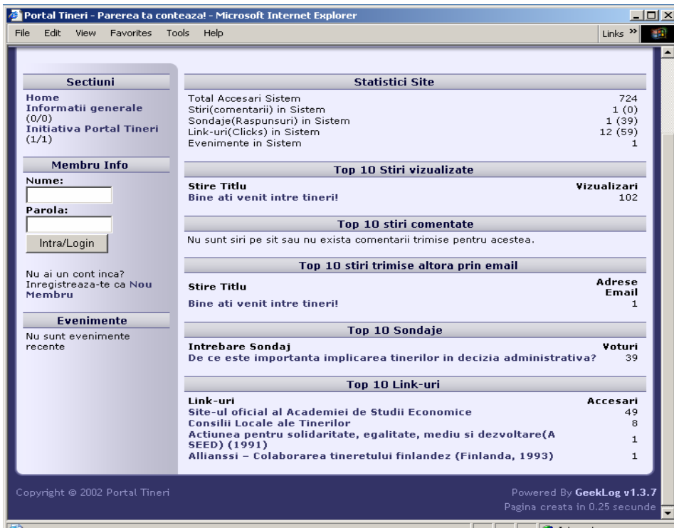
Figura 13 Statistici portal