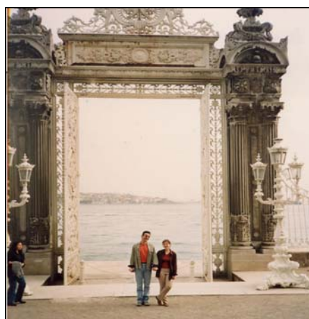
Istanbul, Palatul Dolmabahçe vedere spre Marea Mediterană și Asia

Muzeul de artă turcă și islamică adăpostit de Palatul Ibrahim Pașa, una dintre cele mai frumoase clădiri rezidențiale otomane din Istanbul, expune obiecte religioase, covoare și kilimuri, dar și costume tradiționale din epoca otomană.