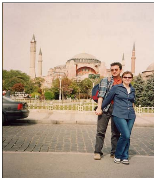
Istanbul, Muzeul Sfânta Sofia (Aya Sofia)

Spre deosebire de Bazarul acoperit, Bazarul egiptean (Miris Çarşisi) a fost la origine o piață de medicamente. Localnicul, pentru că lui îi este adresat, găsește aici plante, păsări, condimente, împletituri din nuiele, obiecte manufacturate, fructe uscate și delicioasele dulciuri turcești – rahat, baclava, fructe confiate.