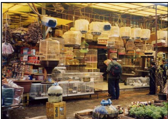
Istanbul, Bazarul egiptean

Bazarul acoperit (Kapalı Çarşı), cu o istorie de 550 de ani, acoperă o suprafață de mărimea unui oraș și este destinat aproape în exclusivitate călătorului străin. Datorită chiriilor mari și șireteniei comercianților, negocierea sfârșește rareori în avantajul cumpărătorului.