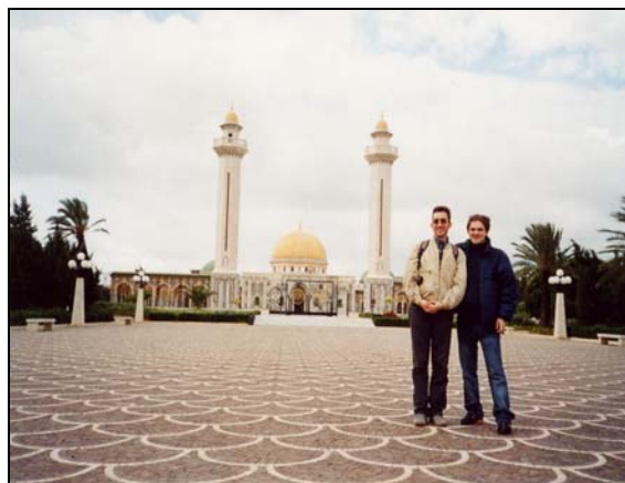
Monastir, Mausoleul Naghib Bourguiba

Oraș de dimensiune medie și centru universitar (alături de alte orașe din Tunisia), Sousse conservă trei mii de ani de istorie. Cele mai importante destinații căutate intens de călător sunt Muzeul de Arheologie, adăpostit de o veche fortăreață – Kasbah, fortăreața din epoca almoravidă – Ribat, Marea Moschee, souk-urile, care sunt foarte animate și muzeele private ale orașului.