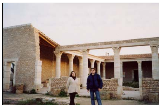
Cartagina, Muzeul de arheologie, locuință romană

bazarul stofelor, El Birka – bazarul bijuteriilor), moschei (Ez-Zitouna, Youssef Dey, El Ksar, Hammouda Pasha), mederse (școli coranice - Mouradia, Echammaia, Achouria), hammam (băi turcești – Kachachine), muzee, biblioteci, mausolee, locuințe particulare, precum și instituții administrative.