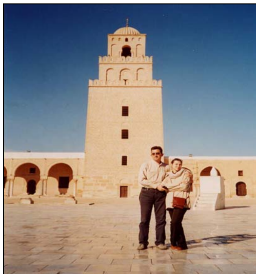
Kairouan Marea Moschee (OKBA)

Situată în nordul Africii, alcătuită împreună cu Algeria și Marocul regiunea cunoscută sub numele de Magreb, Tunisia este o țară islamică ce-și conservă tradițiile cu atenție, deschisă spre modernitatea economică, politică și socială.